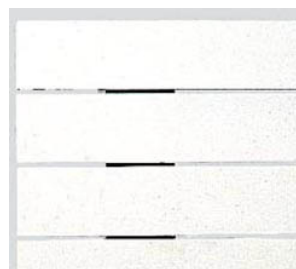
DT-32 白 入 ノ 天 板 102 角 11-0 (脚有り 3-0)