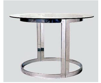
DT-24 サ ー ク ラ イ ン グ ラ ス テ ー ブ ル 105 φ 天板 4-0 脚 10-0