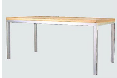
DT-5 アルミフレームダイニングテーブル (walnut top) W160 D80 H71 21-0 天板のみ 8-0