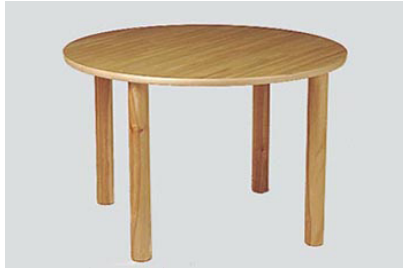
DT-23 ハ ー チ テ ー ブ ル 105 φ H68.5 11-0