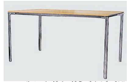
DT-3 フリッツハンセンダイニングテーブル (walnut material) W140 D80 H72.5 28-0