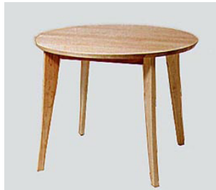
DT-20 メイ ル ル タ イ ン グ テ ー ブ ル 90 φ H70 11-0