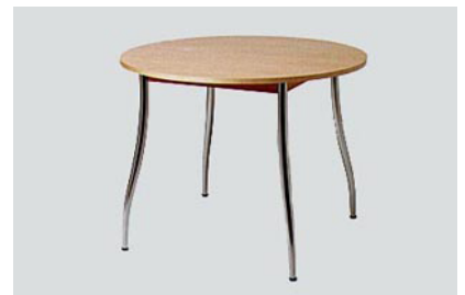
DT-18 Waisダイニングテーブル 90φ H71 12-0