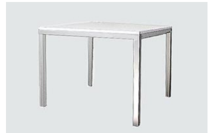
DT-9 アルミフレームダイニングテーブル (白/ガラス天板) 12-5 (白天板) 17-0 90角 H70 白天板のみ 6-0