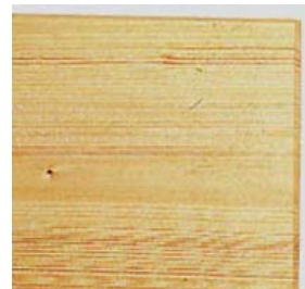
DT-29 白 木 天 板 W120 D80 6-0