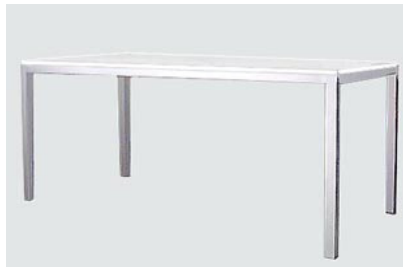
DT-8 アルミフレームダイニングテーブル (白/ガラス天板) 15-0 (白天板) 21-0 W160 D80 H70 白天板のみ 8-0