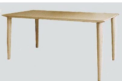
DT-13 Ytダイニングテーブル (オーク) W150 D80 H70 25-0