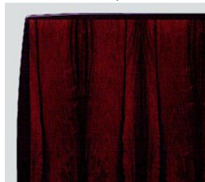
DT-27 ロ ー ズ ウ ット 天 板 20-0 脚有り W140 D85