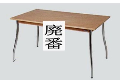
DT-16 Waisダイニングテーブル W135 D80 H72 16-0