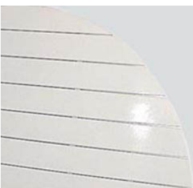
DT-31 白 入 ノ 天 板 120 φ 8-0