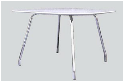
DT-7 オフホワイトエフェクトコンポジットテーブル (オフホワイト) 110角 H72 11-0