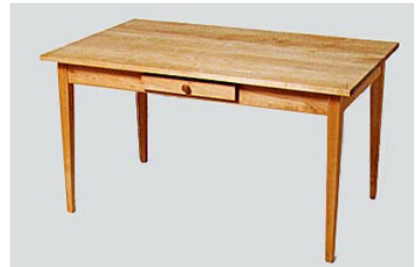
DT-21 サ ー ブ ダ イ ン グ テ ー ブ ル W130 D80 H72 25-0