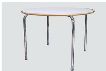
DT-11 カルテルダイニングテーブル 100φ H73 12-0