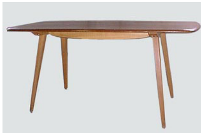
DT-26 ア ー コ ル ダ イ イ ン グ テ ー ブ ル W152 D76 H72 12-5