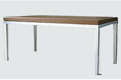
DT-4 アルミフレームダイニングテーブル (ウォールナット) W160 D80 H73 24-0 天板のみ 11-0