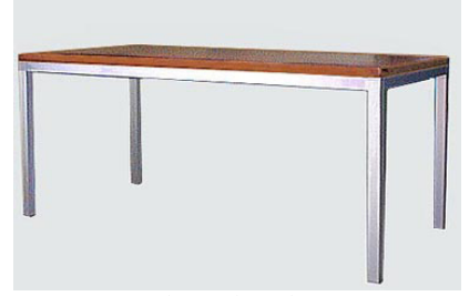
DT-6 アルミフレームダイニングテーブル (cherry top) W160 D80 H71 21-0 天板のみ 8-0