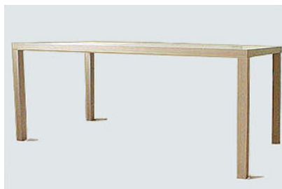
DT-2 ホワイトオークソープフィニッシュダイニングテーブル W160 D85 H68 26-0