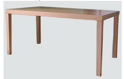
DT-12メイプルトップダイニングテーブル W150 D80 H70 15-0