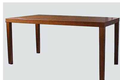
DT-14 チェリー色ダイニングテーブル W150 D80 H70 15-0