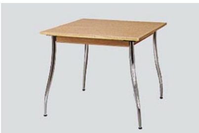
DT-17 Waisダイニングテーブル 80角 H72 15-0