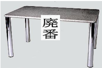
DT-25 ミ カ ゲ 石 風 ダ イ ン グ テ ー ブ ル W135 D80 H70 天板 9-0 脚 4-0 (黒有り 脚 2-5)