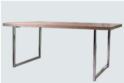
DT-1 ウォールナットクローム脚ダイニングテーブル W180 D85 H75 28-0