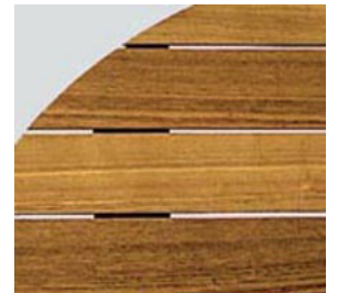
DT-30 白 木 入 ノ 天 板 87 φ 10-0 (脚有り H70 3-0)