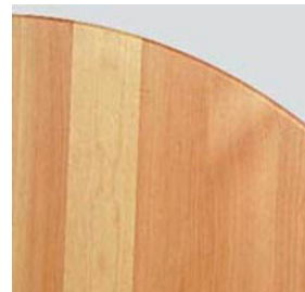
DT-33 白 木 天 板 87 φ 4-0 105 φ 6-0 (脚有り H70.5)