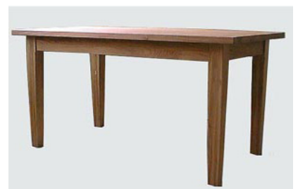
DT-15 オイルフィニッシュダイニングテーブル W135 D75.5 H72 18-0