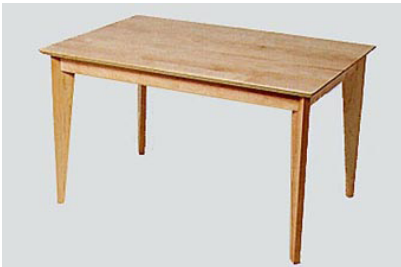
DT-19 メイ ル ル タ イ ン グ テ ー ブ ル W120 D80 H70 12-0