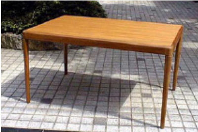
DT-22 チ ー ク ダ イ ン グ テ ー ブ ル W135 D90 H72 24-0