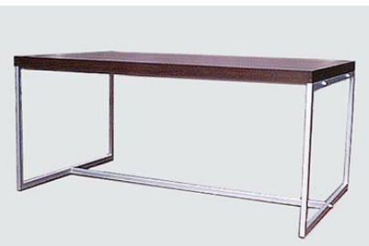
DT-10 アルミフレーム/ウイングダイニングテーブル W150 D90 H70 19-0